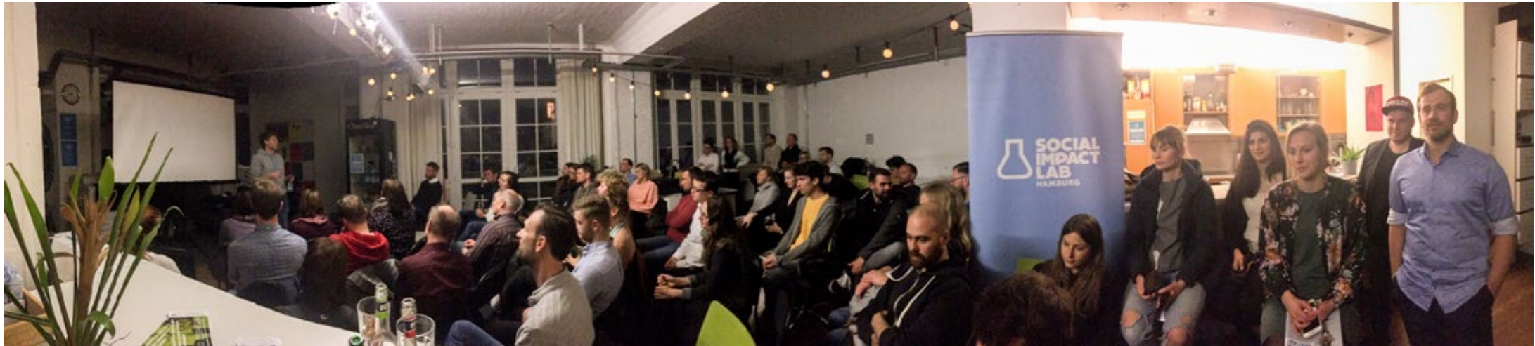
Panorama während eines Meetups.